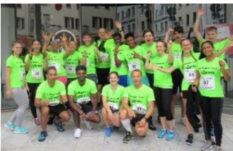
Teilnahme eines Schulteams am Esslingen-Lauf