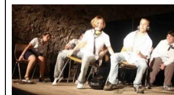
Kooperatives Theaterprojekt von Albert-Schäffle- und Bodelschwingschule